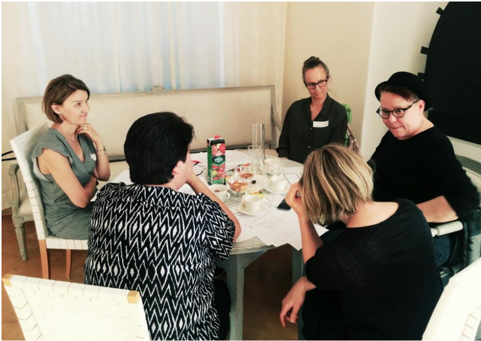
Puntaroivaa keskustelua pienryhmissä (yllä)